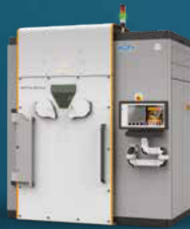
IMPRESORAS DIRECTAS EN METAL