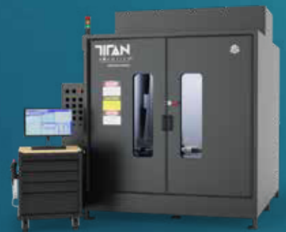
IMPRESORAS DE EXTRUSIÓN DE GRAN FORMATO