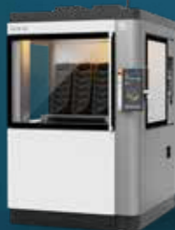
IMPRESORAS DE ESTEREO LITOGRAFÍA