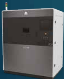
IMPRESORAS DE SINTERIZACIÓN POR LÁSER SELECCIONADAS